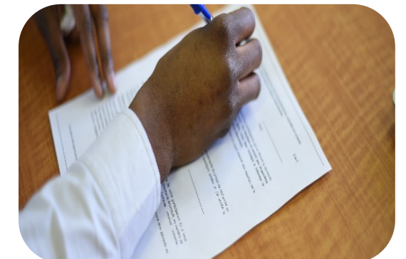
Les récits autobiographiques