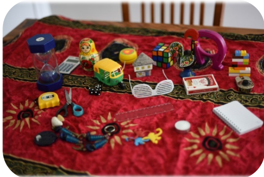
Les objets symboliques